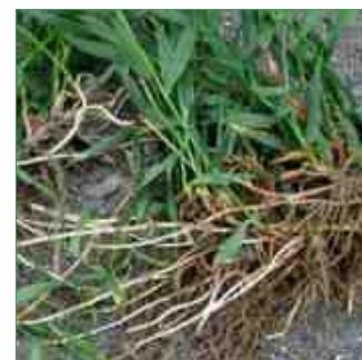
Vlnr: brandnetel, haagwinde, kweekgras

Dan komen we in de ranking bij de energievretende middenmoot: meters zevenblad, kluwen heermoes, bossen haagwinde, beetje bosandoorn, ietsje akkerkool, een enkele melkdistel, een haard van kruipende boterbloem, tandzaad, een snufje paardenbloem, slierten kweekgras en heuphoge brandnetel. Overspannen kun je ervan worden. Als gedreven tuinier kun je het idee hebben dat er een complete veldslag gewonnen moet worden. Dat lukt meestal alleen met een bovenmenselijke inspanning, uitgevoerd met ijzeren discipline en angstwekkende nauwkeurigheid, met daarna zeker nog een jaartje gluren naar zwart landbouwplastic op de bodem om de laatste resten te elimineren. Kortom leef met ‘onkruid’. En als je dan toch een eeuwigdurende klus zoekt, bedenk dan dat tuinieren een stuk leuker is dan huisstof bestrijden. Dus wat gaan we doen in de tuin zodra dit weer kan? Wieden, als de wiedeweerga!