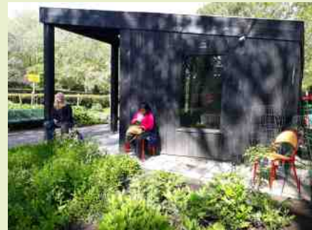
Afstand houden, ook in de koffiepauze

Tot slot. De tuin is nu op zijn allermooist en ik raad iedereen aan: kom hem nu bezoeken! Het is, onder dankzegging aan iedereen die er zo trouw in werkt, een feest voor alle zintuigen.