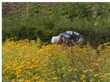
bewerkt door vele handen