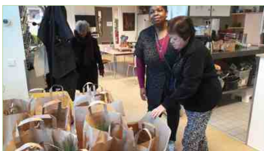
Blij personeel en dankbare mantelzorgers bij Dynamo