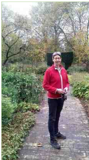
Samen een klus klaren

"Ik ben geboren en opgegroeid op een boerderij in De Peel. Een boerendochter! Dorpen lagen nog aan zandweggetjes. Mijn vader heeft er turf gestoken. Met Marshallhulp van na de oorlog is er een modern agrarisch gebied uit de grond gestampt; eerst gemengd bedrijf, daarna vooral veeteelt. Wanneer je nu in De Peel bent zie je dat weiland weer aan de natuur wordt teruggegeven om opnieuw te laten vervenen. Boerenbedrijven zijn omgebouwd tot manege, vakantieboerderij of golfbaan. En dat in twee generaties! Ik vind dat fascinerend om te zien. Mijn broer ging overigens liever boeren in de USA.