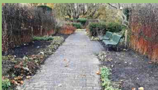
Het helianthen-project. Boven: helianthen uitsteken en grond schoonmaken. Midden: geul met wortelscherm langs de teruggedrongen helianthen. Onder: lege plekken, in afwachting van nieuwe beplanting.