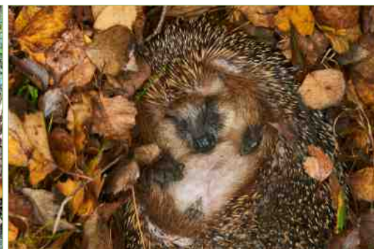
Links: egelhuis in de Bloementuin van Darwin