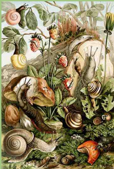
Naaktslakken en huisjesslakken. Illustratie van Henri Morin in "Brehms Tierleben" (1893)