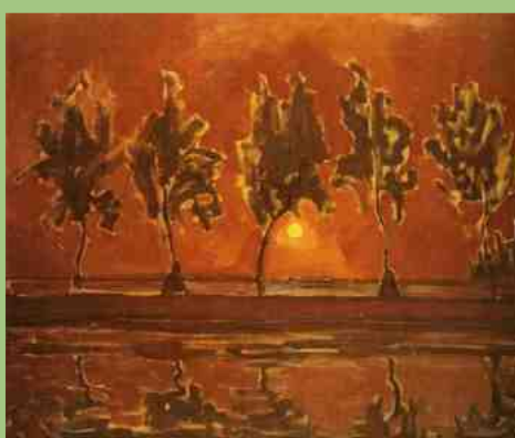
Bomen bij het Gein, opkomende maan Piet Mondriaan (1872-1944)

"Laat vooral mijn mooie irissen en kruiskruid eens met rust!"