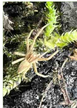
Spinnen in de Bloementuin, v.l.n.r.: web van hangmatspin in de taxushaag, kruisspinnen (man en vrouw) achter op het tuinhuis, kraambespin ergens in de tuin